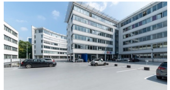
Neuer Campus der FOM Hochschule

Hintergrund des Umzugs: Der Wunsch nach Neuerung und nach Wachstum der Hochschule. „Wir wollen mit der Zeit gehen und haben daher nun einen Ort mit angenehmer Lernatmosphäre und Rückzugsmöglichkeiten geschaffen“, erläutert Rebecca Wanzl. Dadurch könne der Studienbetrieb nun fast ausschließlich am neuen Standort stattfinden.