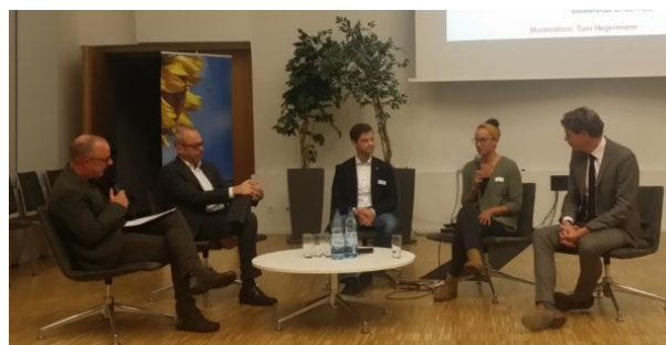
Podiumsdiskussion